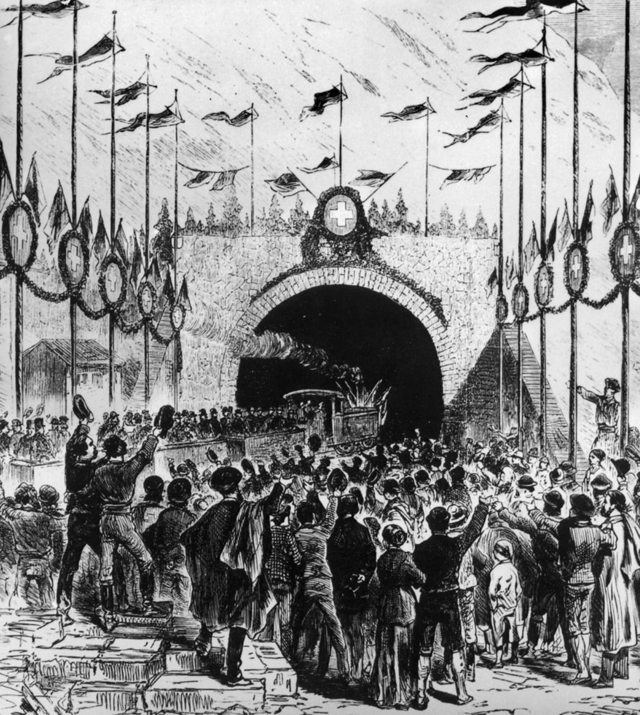
Eröffnung des Gotthardtunnels 22. Mai 1882