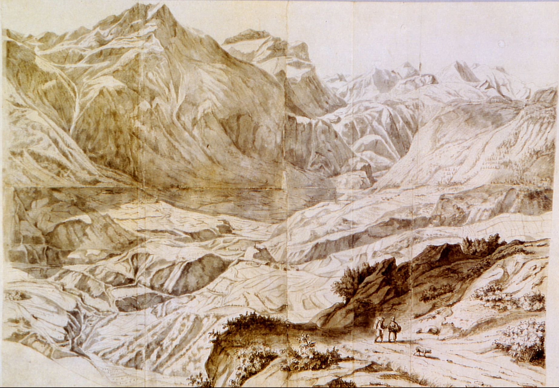
Die Landschaft Schams: Zeichnung Jan Hackaert 1655