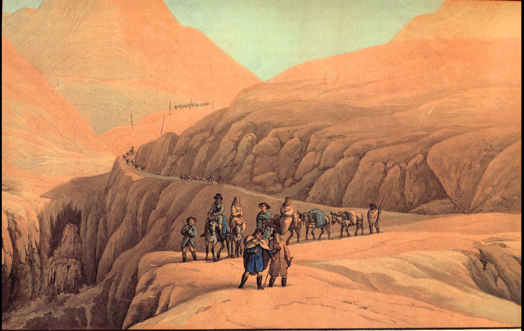
Grande route au mont St. Gothard, en Suisse, non loin de l'Hospice.

Kolorierte Aquatinta nach Zeichnung von J. G. Jentsch, ca. 1800