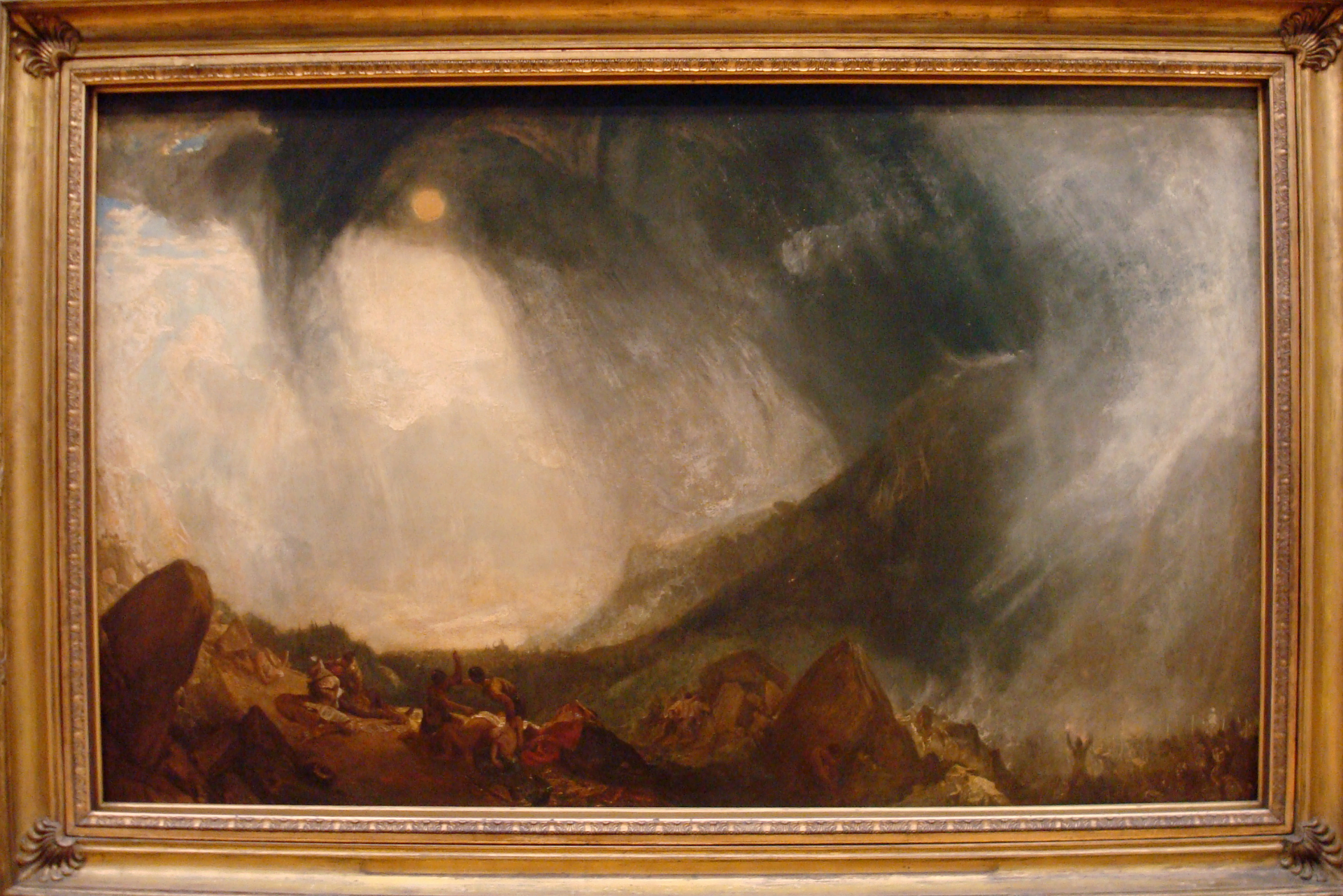
William Turner: Snow storm. Hannibal crossing the Alps 1812