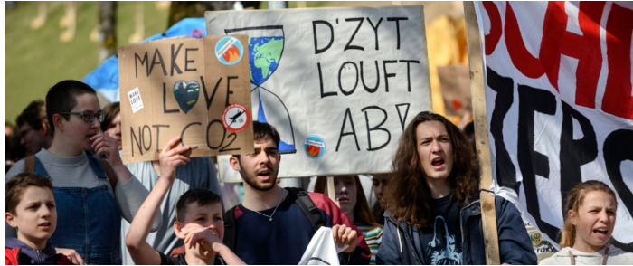
Net zero Switzerland