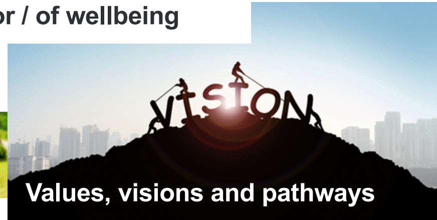
Values, visions and pathways