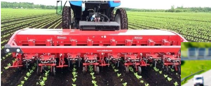
Interrelations and common threads