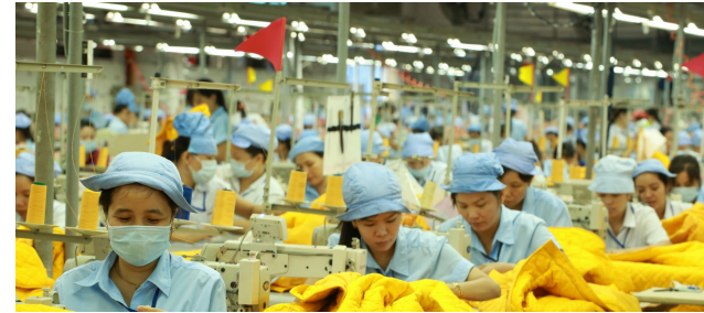
Economics for / of wellbeing