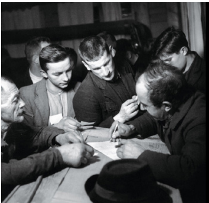
Verteilung des kollektiven Holznutzens (Losholz), Sigriswil 1946.

Ebenso sehr wie von den Obrigkeiten ist die schweizerische Entwicklung aber von der starken Stellung der lokalen Körperschaften geprägt. Nicht weniger als 41 Prozent der schweizerischen Waldfläche gehören heute den Bürgergemeinden und Korporation, weitere 23 Prozent stehen im Eigentum der Gemeinden. Seit der Entstehung dieser Körperschaften im Spätmittelalter bildeten solche «Gemeinwälder» auf dem Gebiet der heutigen Schweiz die vorherrschende Form des Waldeigentums. Sie waren Teil der kollektiv genutzten Allmende, die von den lokalen Körperschaften relativ autonom reguliert wurden. Dabei galt das Prinzip der «Notdurft», das heisst, jeder Nutzungsberechtigte sollte den Eigenbedarf decken können; der Verkauf von Holz aus dem Nutzungsverband heraus war dagegen unter Strafe verboten.