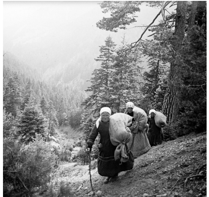
Frauen tragen in Säcken gesammeltes Moos zum Abdichten der Wasserleitungen (Suonen), bei Savièse (VS) um 1935.

Der multifunktionale Nährwald war nicht nur für die lokale Holzversorgung unentbehrlich, sondern auch für die lokale Nahrungsversorgung, direkt als Lieferant von Beeren, Honig, Kräutern, Pilzen, Wildfrüchten und Wurzeln, indirekt als Ort der Waldweide für die Ziegen und Schafe, der Entnahme von Nadeln für die Einstreue im Stall sowie der Gewinnung von Laub zum Füllen der Bettunterlagen. Der damit einhergehende Export an Biomasse und Nährstoffen führte zu lockeren und lichten Waldformen, die in der holzzentrierten Perspektive der entstehenden professionellen Forstadministrationen als Zeichen schlechter Ökonomie gedeutet wurden. 3